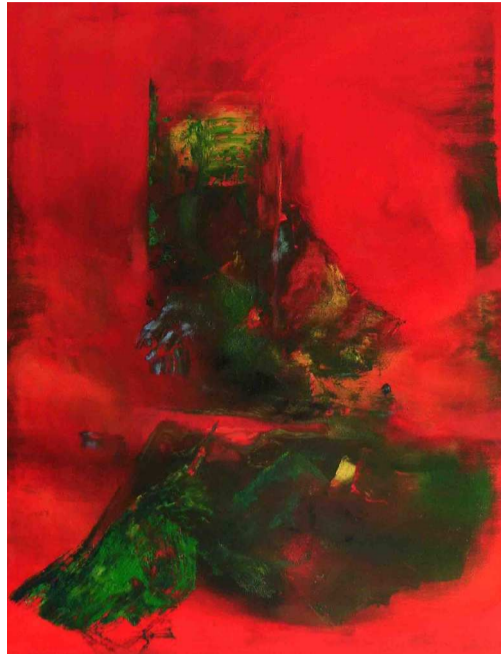
Kosmos Farbe - Spannungsfeld Freiheit und Gegengewalt

Ausstellung mit Bildern von Gotthard Krupp