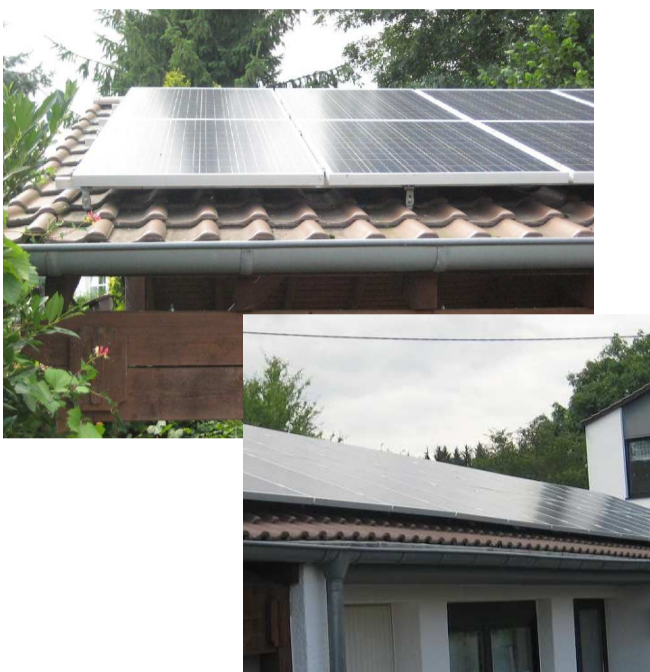
Die neue Photovoltaikanlage auf dem Gemeindebüro und dem Pfarrhaus